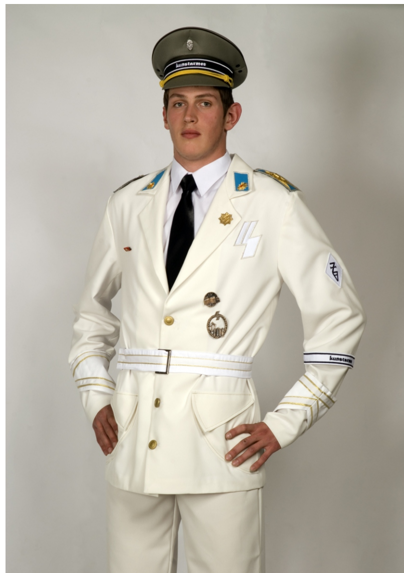
MODEL PRE GENERÁLA POL'NÉHO MARŠÁLA (Hodnosť dosiahol napr. Roman Ondák), 130x95cm, tlač, 2011