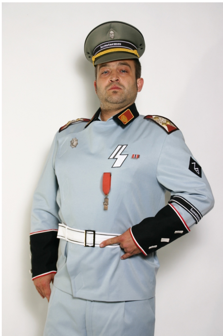
ARMÁDNY GENERÁL ERIK BINDER , 130x95cm, tlač, 2011