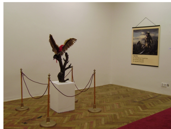
KASSABOYSMUSEUM, NODgallery, Praha / pohľad do výstavy.