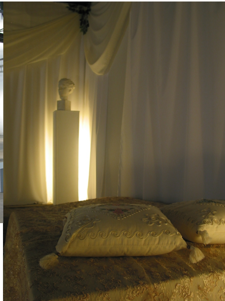
POHĽAD DO INŠTALÁCIE NA PRAGUE BIENNALE 4, 2009