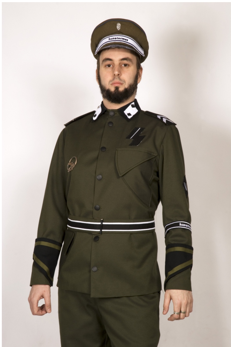
DESIATNIK MICHAL DANKULINEC, 130x95cm, tlač, 2011