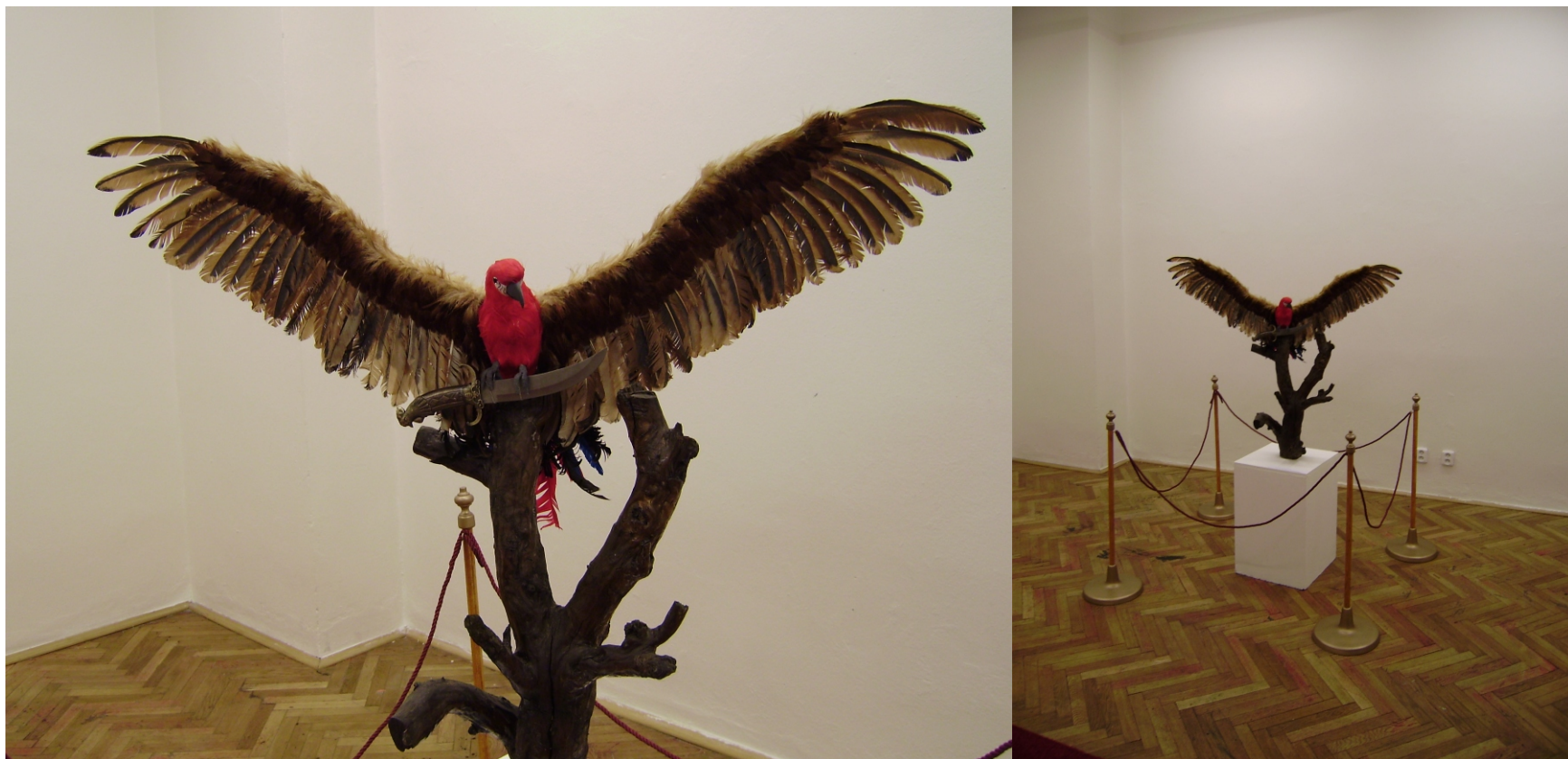
Ohyzdny vtak, ten ma'arsky papagaj, ktorý sa vola Turul, objekt (umely papagaj, konstrukcia, perie) 120x90 cm