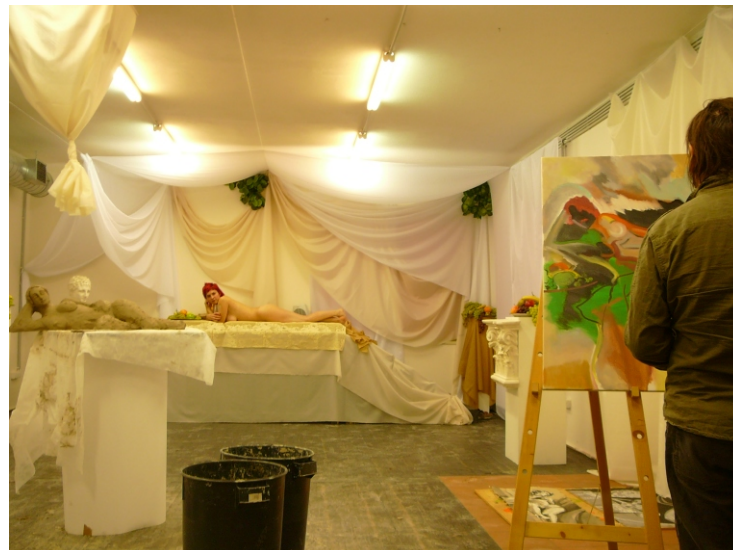
SYMPOSIUM - 5 dňový performance, Stanica - Žilina 2007