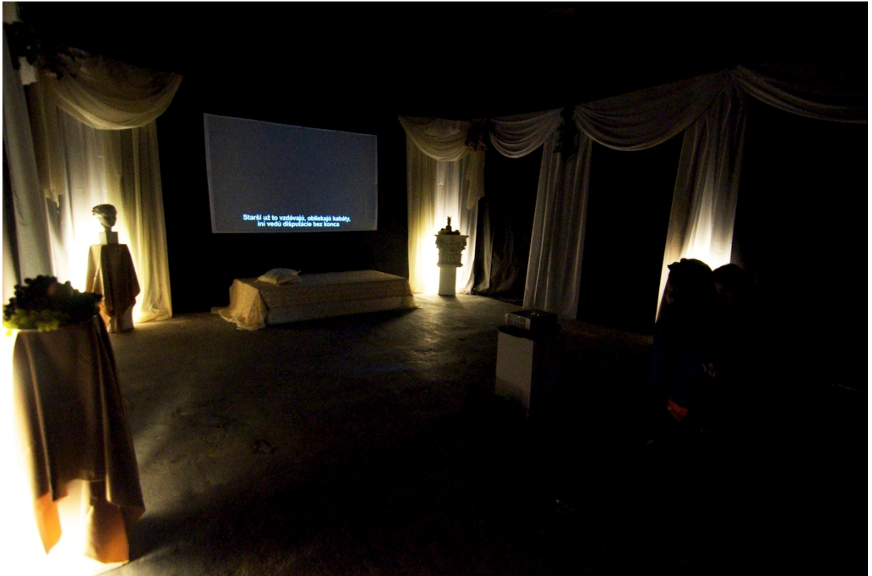
POHĽAD DO INŠTALÁCIE V KASÁRŇACH/KULTURPARKU, 2010