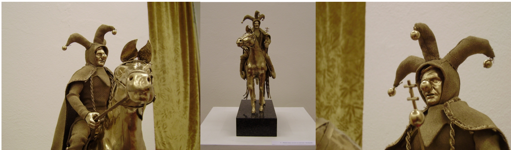
Nejaký maďarský šašo na koni z Budapešti (sv. Štefan), objekt ( kôň, jazdec, textil ) 15x30x45 cm