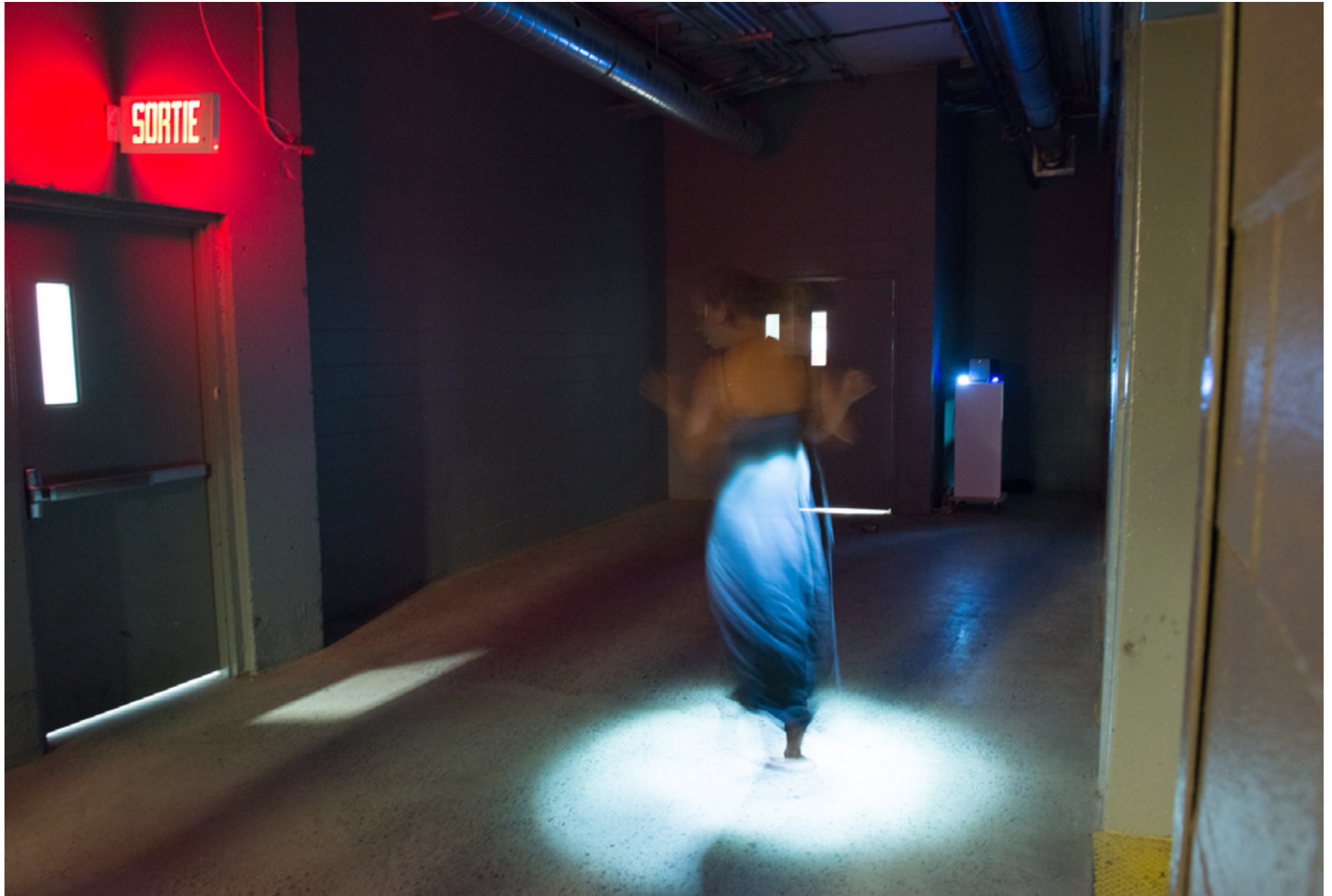
Vicious Circle I / V!VA Art for Action Montreal / 2016 (performance)