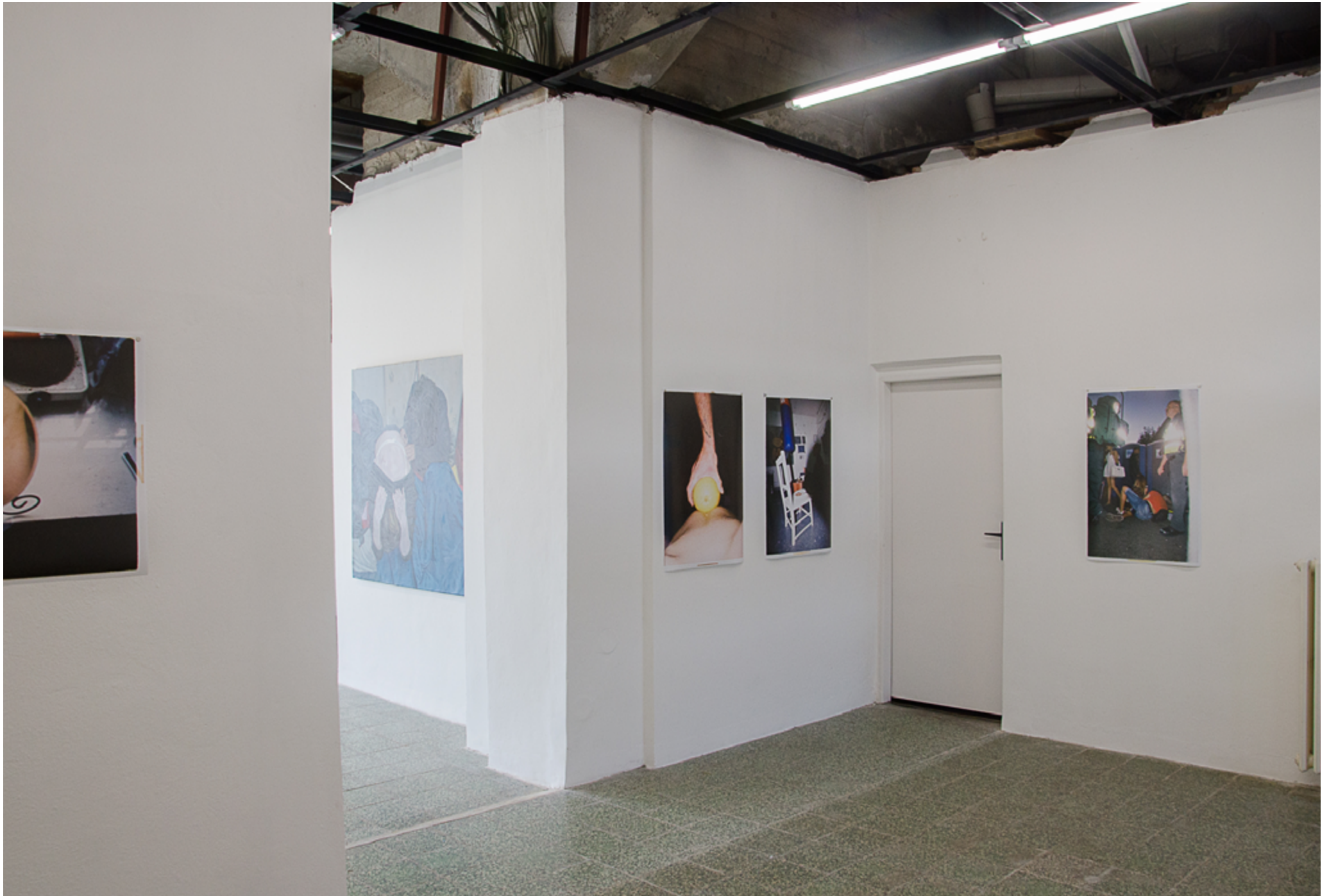
C-HOLE / Photoport, Bratislava / 2018 (exhibition view)